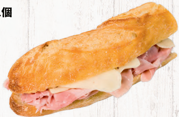
hum cheese bucket sand