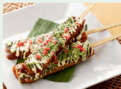
お好み焼き串 600円 /1本