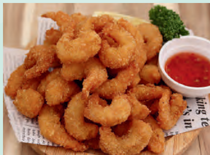
ポップコーンシュリンプ 600円