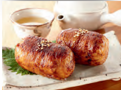
Meat wrapped rice ball