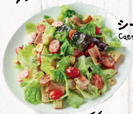
シーザーサラダ ¥1200 Caesar salad