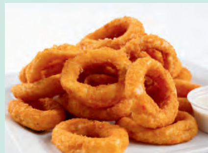
オニオンリング 700円