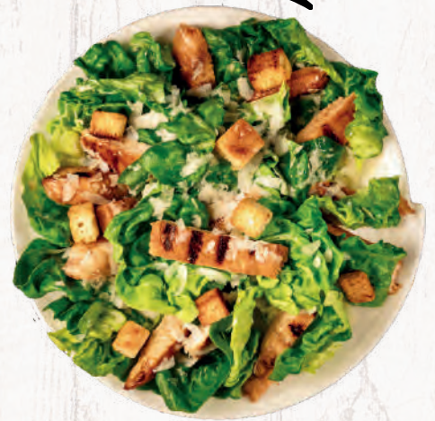
B.A.T.サラダ ¥1200 ベーコン・アボカド・トマト Bacon, Avocado, Tomato, salad