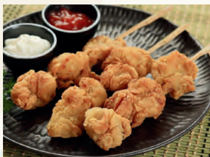
鶏もも唐揚げ串 400円 /1本