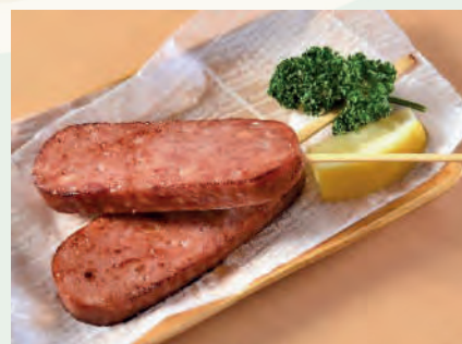
ボロニアソーセージ 400円 /1本