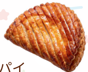
焼きたてアップルパイ