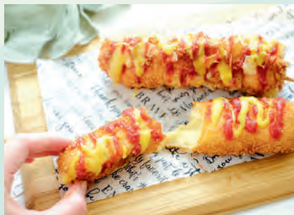
チーズハットグ 600円 /1本