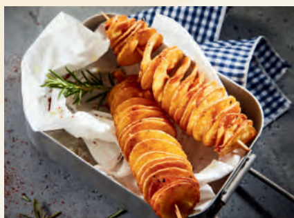
ハリケーンポテト 400円 /1本