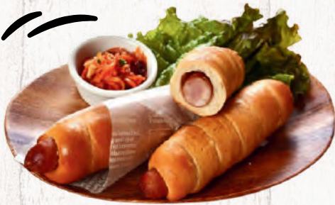
プレッツェルドッグ ¥480 /1個 sausage dog