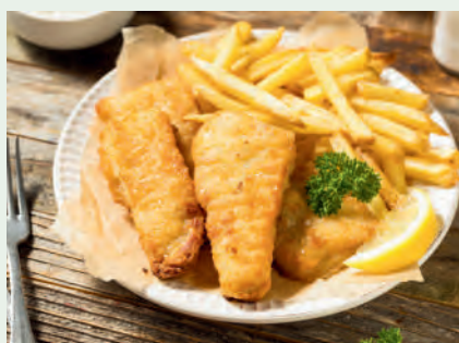
フィッシュ&チップス 1000円