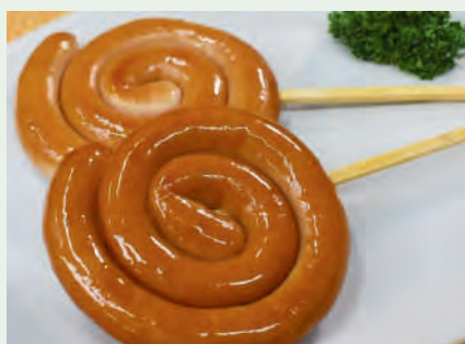
トルネードウィンナー串 550円 /1本