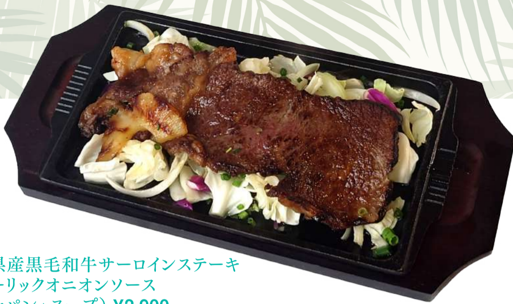
鹿児島県産黒毛和牛サーロインステーキ withガーリックオニオンソース (ライスorパン+スープ) ¥2,900

Kagoshima Black Wagyu Beef Sirloin Steak with Garlic Onion Sauce ジューシーな肉汁とがっつりとした食べ応えの贅沢な一品。