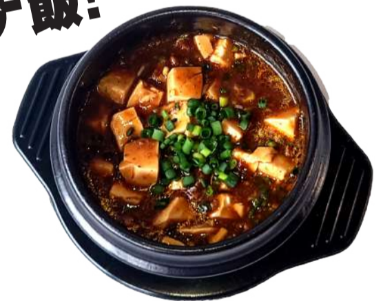
麻婆豆腐(ライスorパン+スープ) ¥1,200