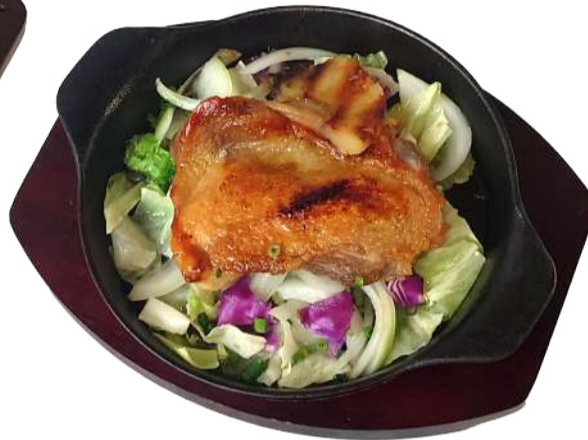
鹿児島県産若鳥のソテーwith 香味おろしソース (ライスorパン+スープ) ¥1,200

Grilled Amami Pork with Ginger Sauce 香ばしく焼き上げた肩ロースの肉本来の味わいが際立つ。