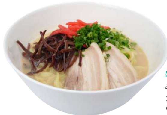
特製とんこつラーメン ¥1,100

奄美の人気豆腐料理専門店「島とうふ屋」の絹豆腐を使用。滑らかな口当たりでほどよい辛さ。