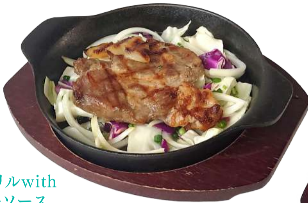
島豚のグリルwith ジンジャーソース (ライスorパン+スープ) ¥1,500

Grilled Amami Pork with Ginger Sauce 香ばしく焼き上げた肩ロースの肉本来の味わいが際立つ。